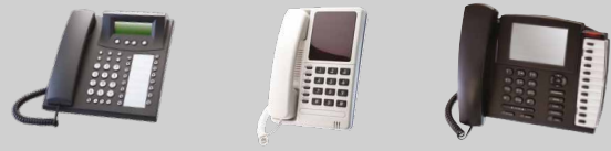
FT10 OP48S OP50